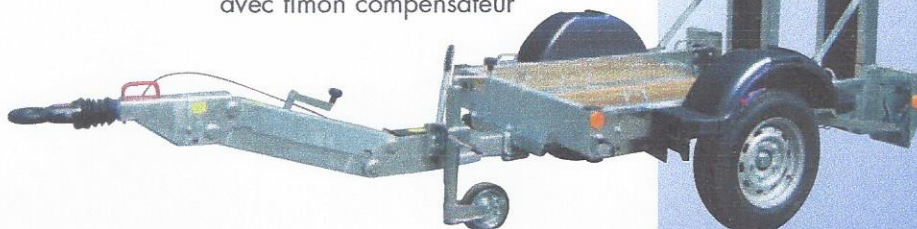
PEGD 15 TA 130 AF avec timon compensateur

Option timon articulé avec compensateur d'effort sauf pour PEGD 25 TA 180 AF