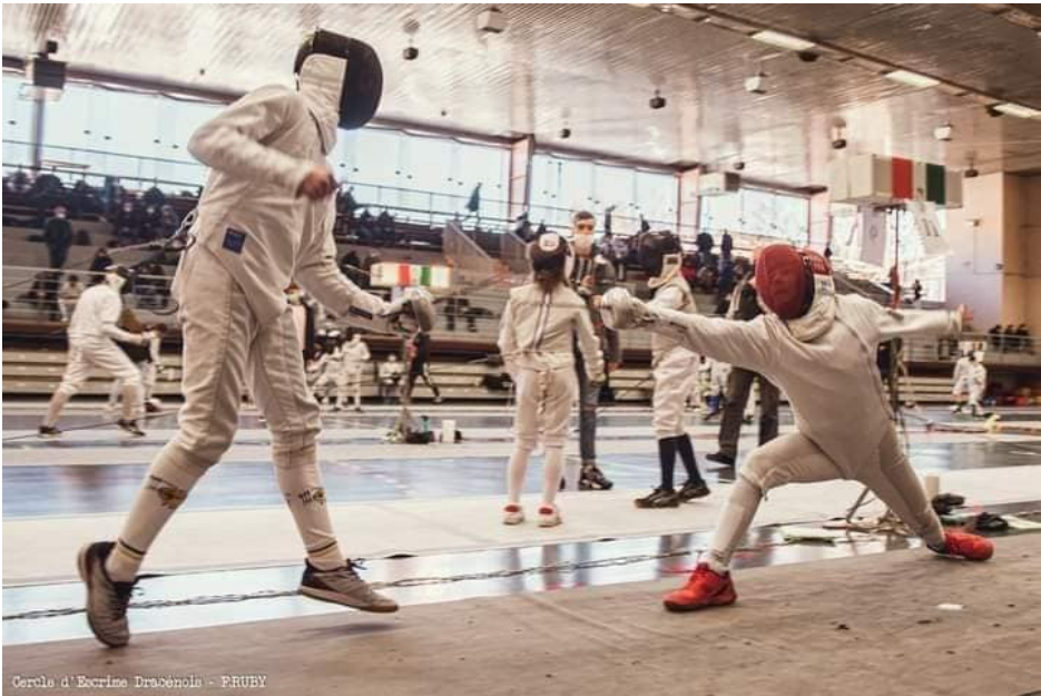
Cercle d'Escrime Dracònia - FRUBY