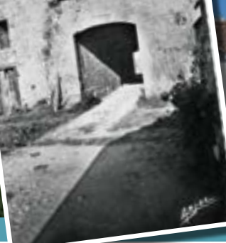
Canton de la Seigneurie